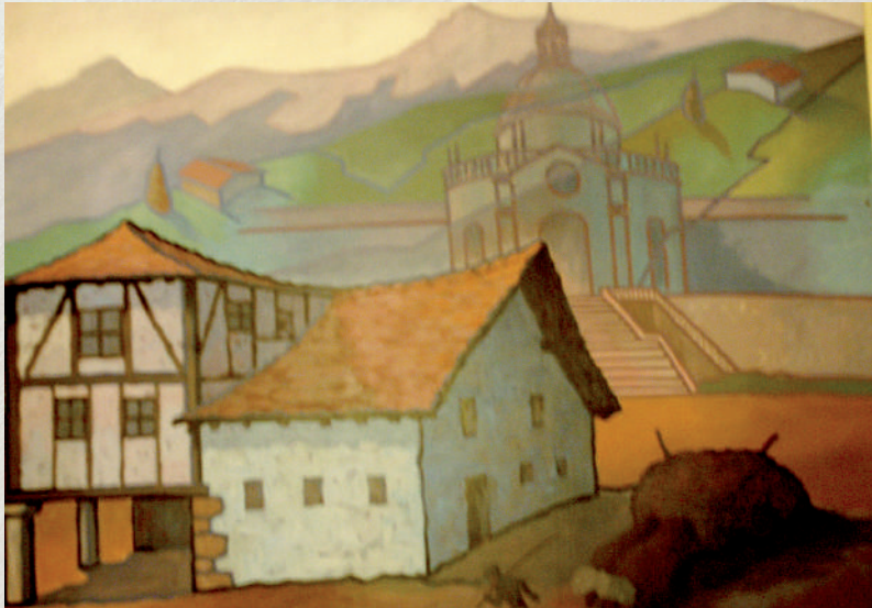
Caserío de Gárate en Loyola

después de tanto esfuerzo no hay fruto que cosechar. Me inspira su trayectoria y su figura porque me anima a integrar mi propia experiencia y mis propias inseguridades desde su ejemplaridad. Lo que aprendí en el espacio educativo fuera del aula (en lo extracurricular, en Deusto Campus... y también en una huerta, dicho sea de paso), es probablemente lo más valioso. Y ahora me toca aprovecharlo en el aula. El debate incluido.