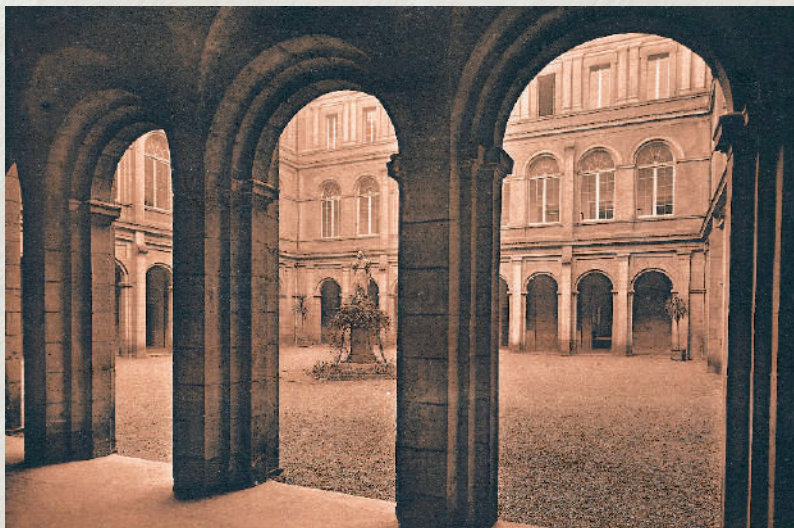
Claustro de la Universidad de Deusto